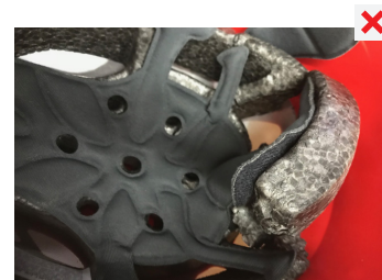
POŠKOZENÁ TLUMICÍ ČÁST