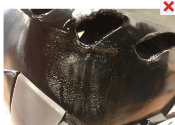
POŠKOZENÍ SKOŘEPINY ZAHŘÁTÍM