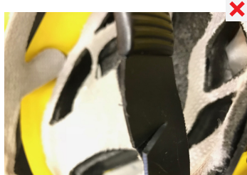
POŠKOZENÍ ČÁSTI SEŘIZOVACÍHO SYSTÉMU