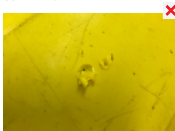
POŠKOZENÁ SKOŘEPINA - OSTRÝ PŘEDMĚT